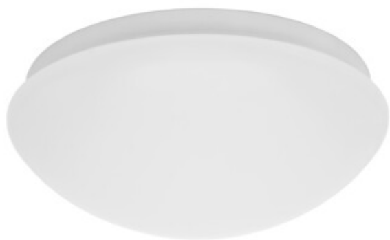
PIRES ECO DL-250